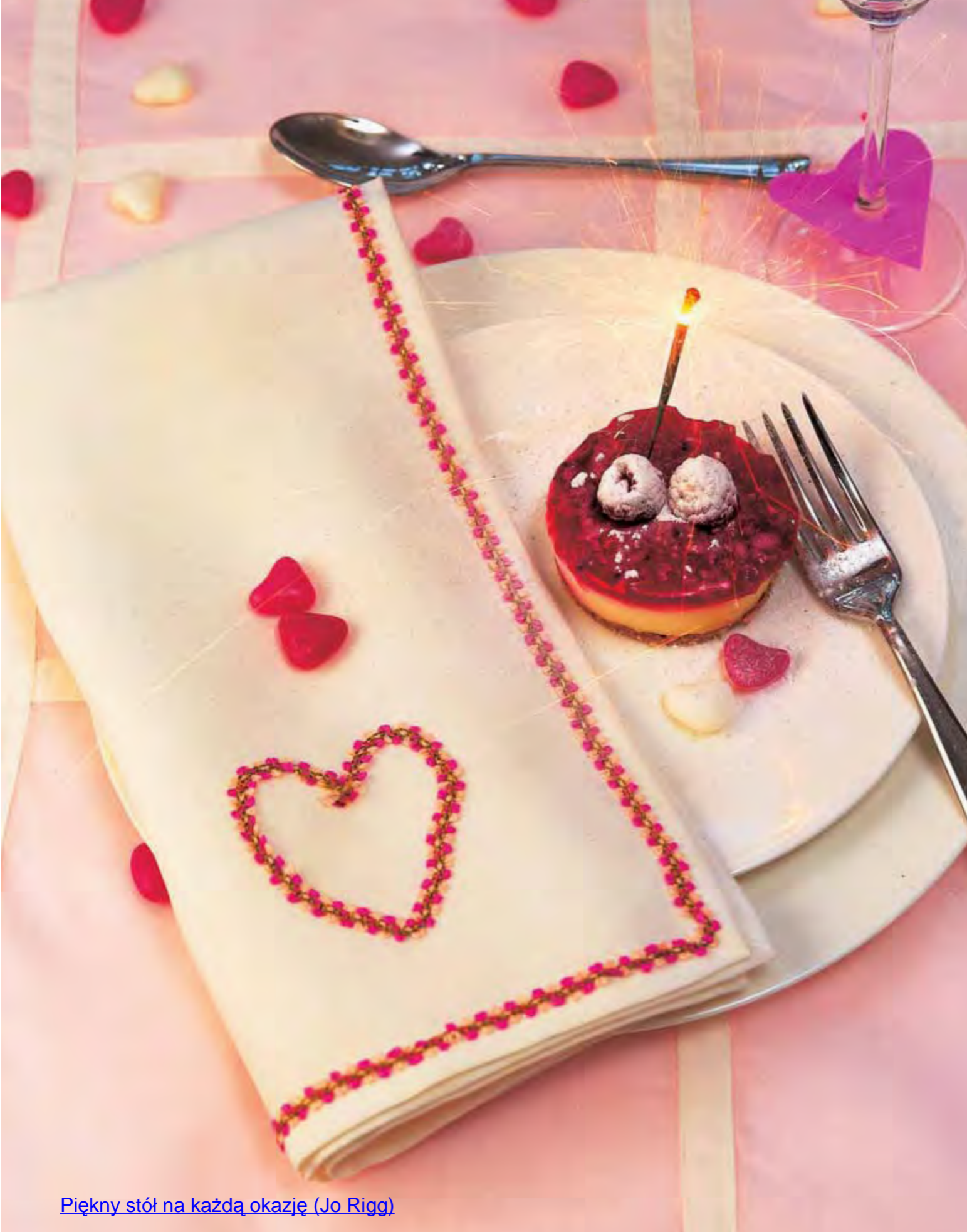
Piękny stół na każdą okazję (Jo Rigg)