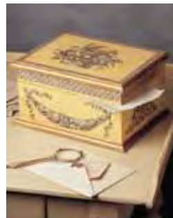
Powyżej: Farba w kolorze „antycznego” złota nadaje przedmiotom ozdobionym metodą decoupage'u elegancki wygląd.

Trzymając pędzelek jak pisak, przyłóż go do góry krawędzi malowanego przedmiotu. Odsuń się na pewną odległość i oprzyj rękę na stole, a następnie maluj pędzlem w kierunku do siebie, balansując do równowagi małym palcem. Pod koniec stopniowo ułoń pędzelek, aby nie wyjechać z linią poza krawędź. Jeżeli musisz nasaczyć pędzelek, ułoń go stopniowo, a potem zanurz go w farbie. Ciągnij linię dalej, nakładając na już namalowany fragment, aby uzyskać równomierne nasycenie kolorem. Pozostaw do wyschnięcia, a jeżeli okaże się to konieczne, nałóż kolejną warstwę farby dla lepszego pokrycia.