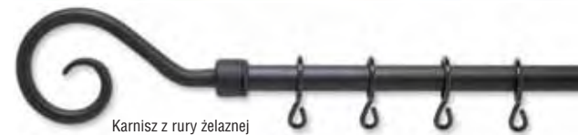
Karnisz z rury żelaznej