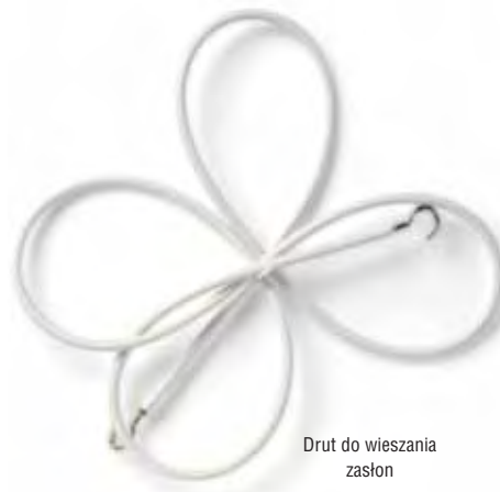
Drut do wieszania zasłon