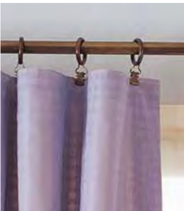
Powyżej: Żabki rozmieść co 10–15 cm.