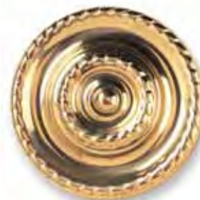
Rozeta do upinania zasłon

Haczyki mogą mieć różny kształt, pasujący do wybranych karniszy lub szyn. Są zakończone wkrętem do mocowania. Mniejsze służą do podtrzymywania podszewki.